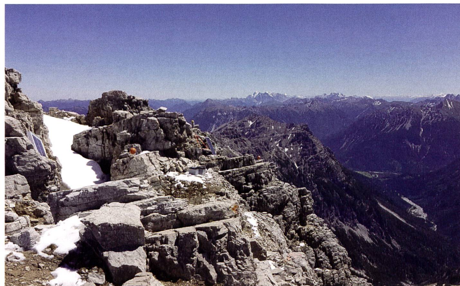
Abb. 1: Verschiedene Sensoren auf dem Hochvogel. Fig. 1: Diversi sensori Hochvogel.

ten arbeitet, alle Berechnungen automatisch auf internen Servern durchgeführt werden und die Datenausgabe wahlweise über die Happy Web Page, FTP Push oder über eine XML-Abfrage stattfinden kann. Besonders die XML-Abfrage und die Integration der Daten in einen bereits bestehenden Monitoring Daten Viewer ist sehr einfach zu bewerkstelligen. Die Installation der Sensoren erfolgt innerhalb von wenigen Minuten. Die Sensoren können über eine vorhandene Stromver-