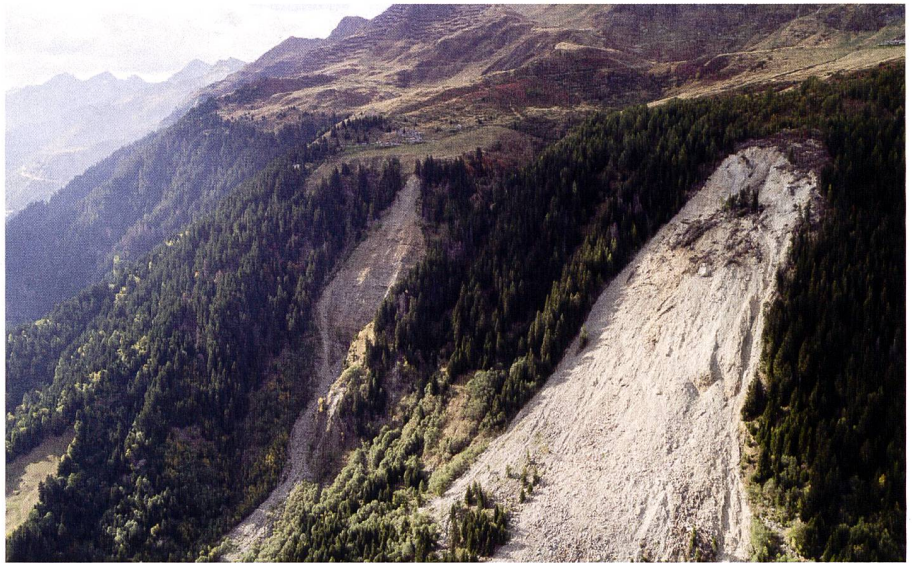
Abb. 2: Erdbeben im Val Canaria.

Bereits seit einigen Monaten wird Happy Monitoring am Hochvogel eingesetzt und getestet. Es hat sich bisher als sehr zuverlässig herausgestellt und liefert hervorra-