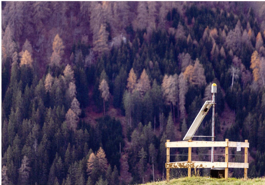
Fig. 3: Installazione tipo a Brienz.

Abb. 3: Beispiel einer Installation in Brienz GR.