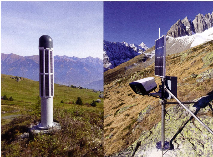
Abb. 1: Robuste GNSS-Station (links) und Kamerastation (rechts). Beide Stationen sind für den alpinen Einsatz konzipiert und arbeiten autonom.

Zentraler Bestandteil von automatischen Überwachungsmessungen ist eine geeignete Visualisierung über ein Webportal. Vermehrt werden unterschiedliche Messsysteme für die Überwachung eines Objektes eingesetzt, einerseits für Redundanz und andererseits zur gegenseitigen Ergänzung. Nur wenige Systeme sind heute schon in der Lage, eine Integration verschiedener Messsysteme auf Stufe der Auswertung durchzuführen. Ein solches Beispiel ist die bildbasierte 4D-Rekonstruktion, welche mit GNSS-Positionslösungen ergänzt und optimiert werden kann. In Tabelle 1 sind einige typische Technologien im Bereich der Naturgefahrvermessung gegenübergestellt. Eine Kombination unterschiedlicher Technologien im Bereich der Visualisierung und Auswertung wird in den kommenden Jahren an Bedeutung gewinnen.