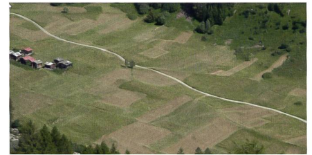
Abb. 1: Weeschtu Mattä in Blatten.

Unter Bewirtschaftungsarrondierung versteht man die Zusammenlegung aller Parzellen der Landwirtschaftszone und deren Neuverteilung unter den Bewirtschaftenden. Sie umfasst alles Pacht- und Eigenland der Landwirte und Landwirtin-