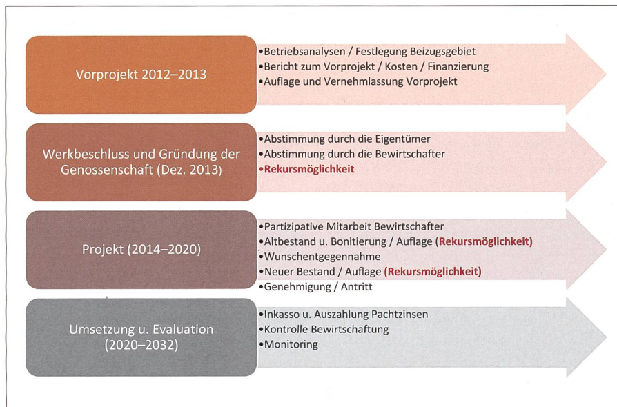
Abb. 3: Ablaufschema der Arrondierung.