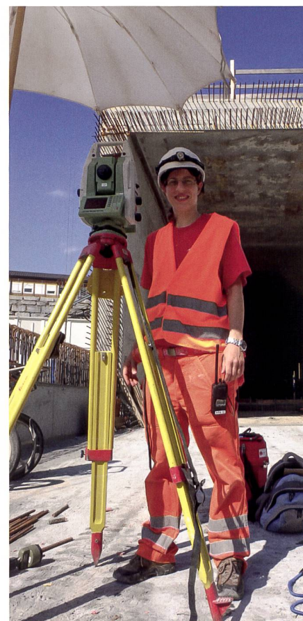
Abb. 1: AlpTransit Baustelle – Ceneri-Basistunnel, Vezia Portal, Vermessung der Haupttunnelpunkte, September 2014.

Im Rahmen meiner beruflichen Tätigkeit im Bereich der Bauvermessung habe ich neben verschiedenen Kontroll- und Überwachungsaufträgen unterschiedlicher Art und Grösse über das Consorzio Geodetico Sud (COGESUD) die verschiedenen Vermessungsarbeiten im Rahmen des Projekts AlpTransit Ceneri-Basistunnel geleitet. Insbesondere war ich in Zusammenarbeit mit den anderen Ingenieurkollegen des Konsortiums mitverantwortlich für das gesamte Management der Fest-