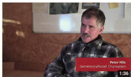
Abb. 2: Trailer Website Kooperation.

ten als wichtigste Hürde genannt 3 . Eine weitere Ursache für den zögerlichen Einstieg in Kooperationen besteht auch darin, dass zu