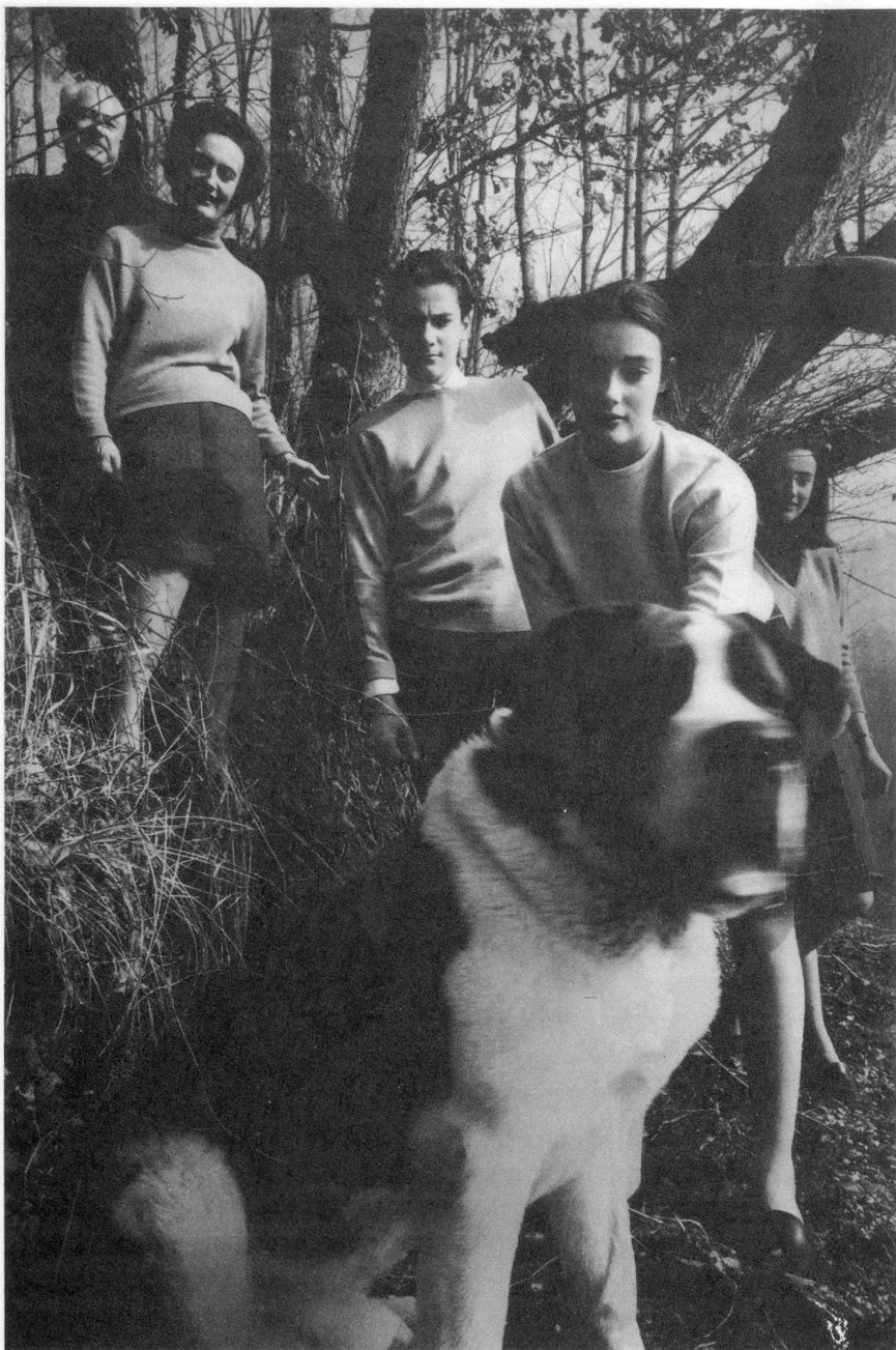
Le domaine de Prangins possède des prés, des espaces couverts d'un gazon soigneusement taillé, un étang et des forêts. La famille aime à s'y promener, et le fidèle St-Bernard Olav est chaque fois de la fête.