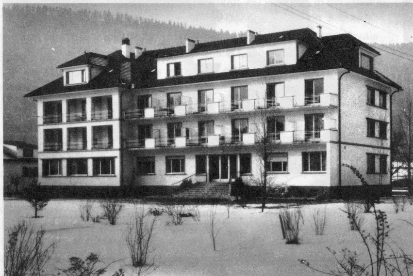
Le Home de Fleurier, une grande maison claire. Toutes les chambres sont individuelles ; leur confort est très étudié.

N'est-ce pas aussi beaucoup grâce à M. Jéquier, qu'à la suite d'un décret cantonal, tous les homes édifiés sur terre neuchâteloise – Buttes et Fleurier compris – bénéficient d'une aide de l'Etat de 20 % pour leur construction. Bref, ces succès impressionnants permirent d'aller de l'avant sans perte de temps.