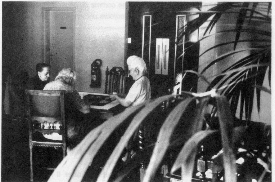
Une partie de cartes dans le salon-hall d'entrée. Un autre salon fait suite au réfectoire.