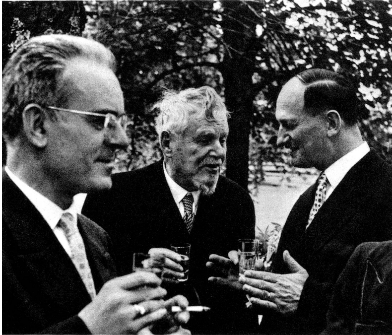
« Première » de la « Servante d'Evolène » en 1956, à Mézières. Les conseillers fédéraux Lepori et Chaudet entourent le héros de la journée : René Morax.

« Bah ! dit René Morax avec sa générosité coutumière, on a découvert aujourd'hui même, et on va le savoir de plus en plus, le grand musicien que vous êtes. C'est cela qui importe. »