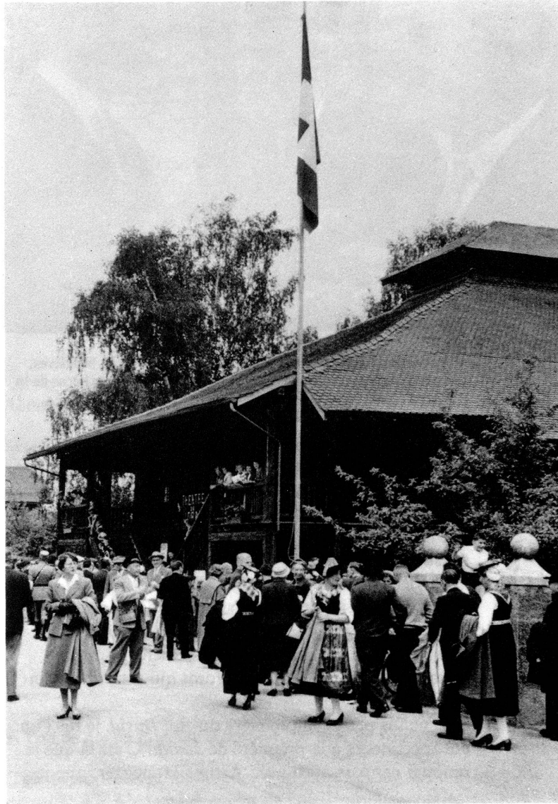
Le Théâtre de Mézières : art et patrie.