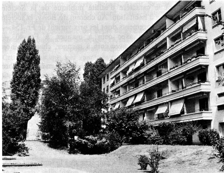
Une des belles réalisations de la Société coopérative d'habitation Lausanne, au chemin de la Suetta à Prilly. Ces immeubles sont subventionnés, soumis à la loi cantonale sur le logement. Deux pièces au 2 e étage coûtent Fr. 122.— + 25.— de chauffage soit Fr. 147.—. Deux pièces au 4 e étage coûtent Fr. 153.—, chauffage compris. Immeubles avec ascenseur.

» Les autorités ont le devoir de veiller à l'application de ce barème. Elles le font avec humanité. Mais si le dépassement est trop important, l'intéressé doit démé-