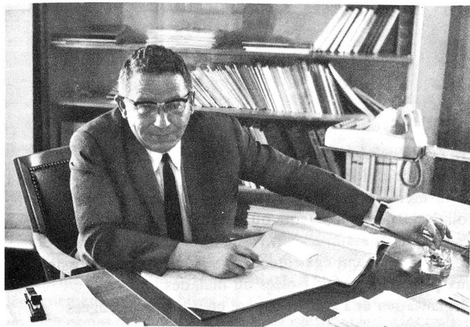
M. Guy Genoud, conseiller d'Etat valaisan.

sation: la rénovation de la grande maison de Leuk-Susten; des maisons de repos à Lens, à Saint-Maurice, à Sion, à Brigue... »