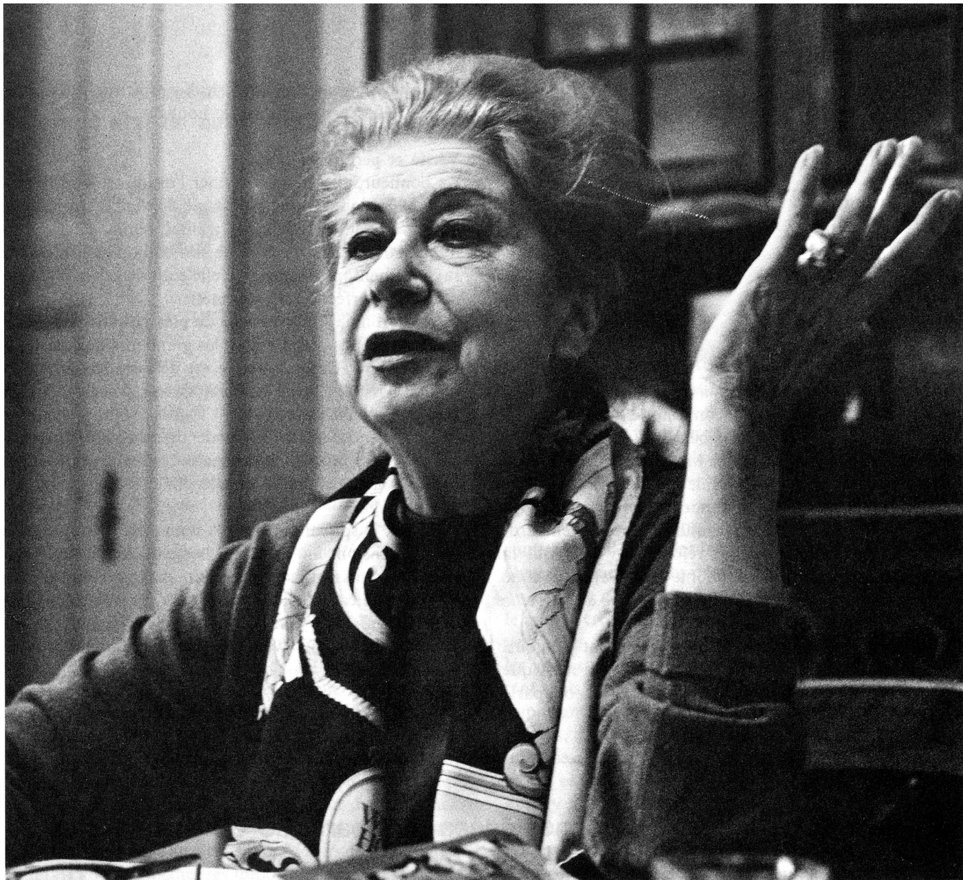
« Le bonheur, c'est sûrement l'amour... » (Photo Alain Gavillet).

« Le bonheur n'est pas de ce monde. Ce ne sont que de petits moments ajoutés les uns aux autres. Le bonheur est au-delà... »