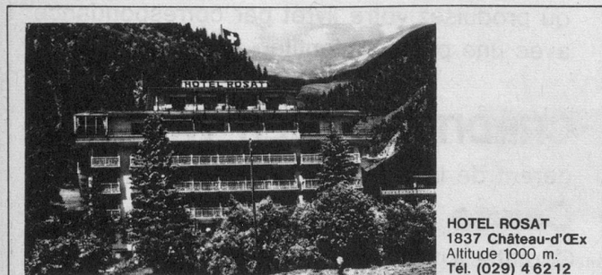
HOTEL ROSAT 1837 Château-d'Œx Altitude 1000 m. Tél. (029) 4 62 12

Les ravissants salons de jardin comprenant table, fauteuils, chaises, parasol, balancelle et nappe, le tout harmonieusement assorti, sont assez coûteux. Toutefois, sans beaucoup de frais, il est aisé de se composer son propre ensemble. Quelques bancs, une table de bois ou de fer laqués — le blanc tranche admirablement sur le gazon — quelques fauteuils, feront de votre jardin un coin confortable. Toutefois, si une averse vient à tomber, les meubles en plastique sont pratiques. Le grand classique de l'ameublement de plein air reste le bois laqué qui supporte l'ondée, mais doit être essuyé et repeint au bout de deux à trois années. Ne boudez pas le rotin et l'osier, matériaux traditionnels du jardin. Si vous disposez de fort peu de place, choisissez des meubles italiens « mini-encombrement ». Et pour garder un coin de fraîcheur, n'oubliez pas le parasol ou la parasolette de fauteuil. Plus les teintes de ces écrans solaires seront vives, plus elles égayeront votre jardin. Peut-être aimez-vous posséder un hamac pour piquer un petit somme ? Si les arbres suffisamment solides manquent, il existe des montures métalliques pour hamacs. Avec un rien de fantaisie et de goût, on peut s'oxygéner sans quitter son chez-soi.