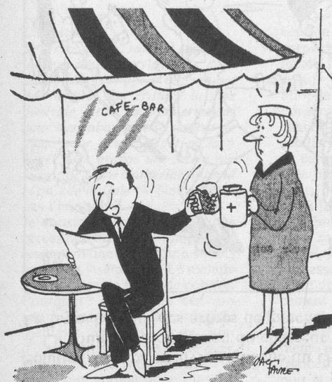
— A la vôtre... (Dessin de Faure - Cosmopress)