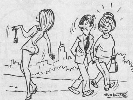
— J'admire les femmes qui savent économiser en tout... (Dessin de Sabatès)

de nitrate d'argent pour cinq litres d'eau prolongera de plusieurs jours la fraîcheur des fleurs coupées. Si celles qui ornent votre vase exsudent du latex, les canaux par lesquels elles boivent s'obstrueront. Pour prolonger leur vie, présentez donc le bout de leur tige au-dessus d'une flamme. Le feu, en carbonisant superficiellement les tissus des fleurs riches en latex leur permettra de mieux boire.