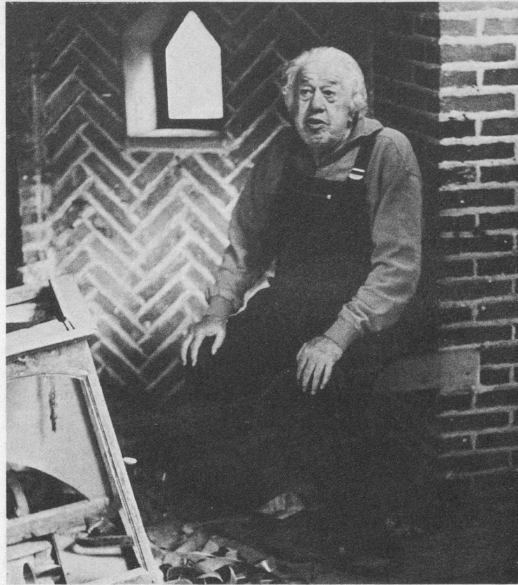
La lucarne qui permet d'éviter les casse-pieds.