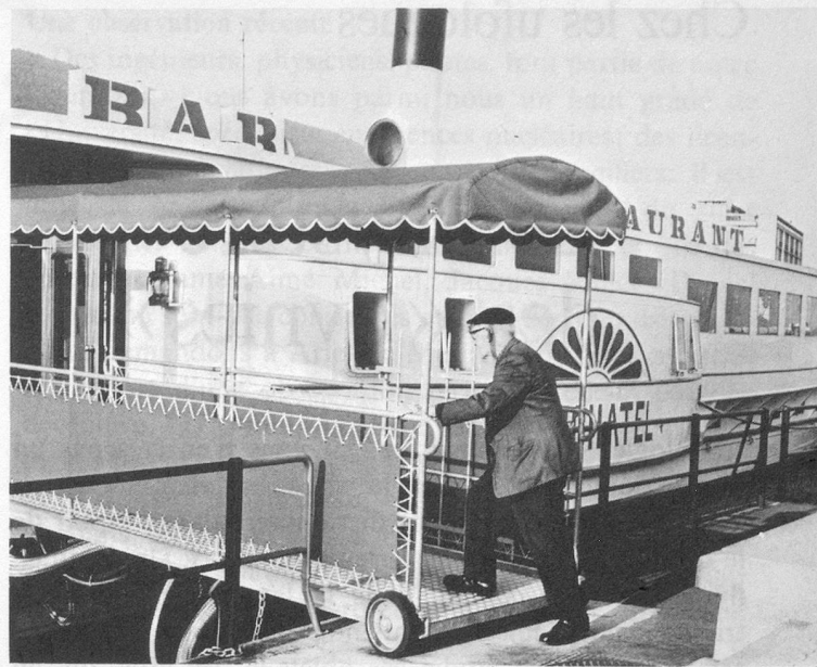
Ces bateaux, il les connaît jusqu'en leurs moindres recoins.