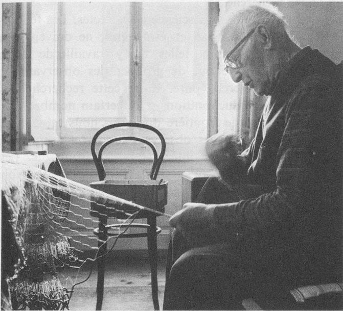
On lui commande toujours des filets de pêche.