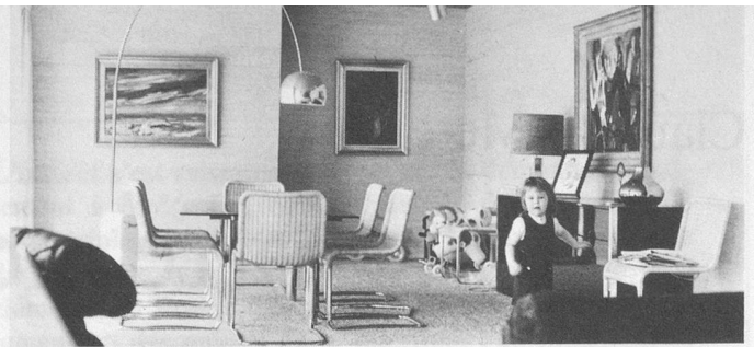
Des spots orientables ont remplacé les bacs de néon. Ils permettent d'éclairer la terrasse et les tableaux.