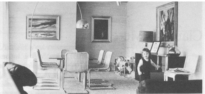
Des spots orientables ont remplacé les bacs de néon. Ils permettent d'éclairer la terrasse et les tableaux.