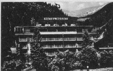
HOTEL ALPINA-ROSAT 1837 Château-d'Œx Altitude 1000 m. Tél. (029) 4 62 12

(Voir reportage dans « Aînés » n° 4 - page 10)