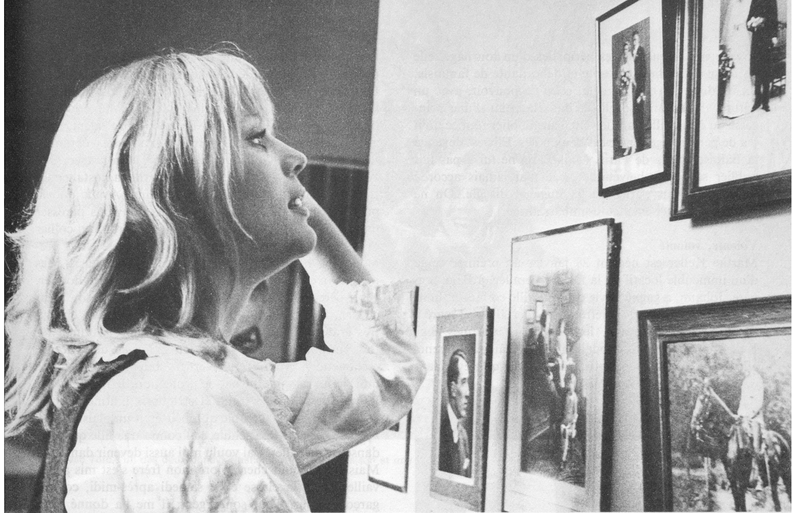
A la place d'honneur, la photo du mariage de ses parents.

Une «petite nana bâloise» qui est belle et qui a beaucoup de talent