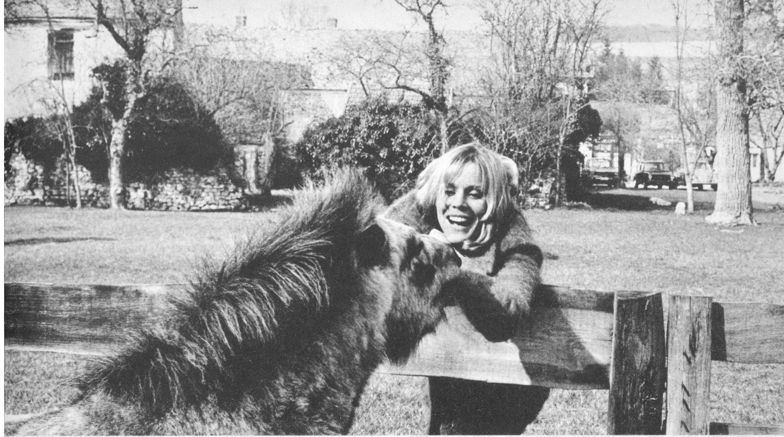
Flirt avec Toto, l'un des deux poneys Shetland. Au fond, la maison et une partie du parc.