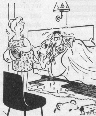
Depuis le temps que tu me reproches de te réveiller trop «sèchement»... (Dessin de Sic-Cosmopress)