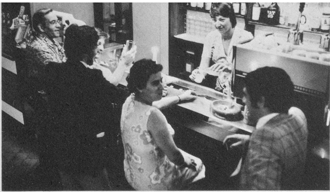
Confort, délassement: le bar du Nike.