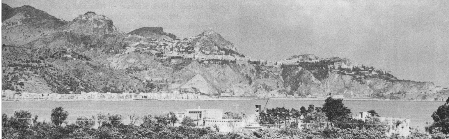
Vue de l'hôtel sur Taormina.