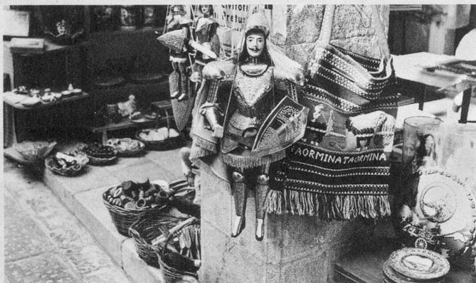
Mille souvenirs, partout, de vos vacances siciliennes.

A Naxos, deux hôtels sont à votre disposition. Ils sont des plus accueillants et confortables. Le Kalos , un peu plus luxueux que le Nike , possède un ascenseur. Il est donc plus spécialement destiné aux personnes se déplaçant avec difficulté. Son prix est un peu plus élevé que celui du Nike qui est également un établissement très plaisant. Toutes les chambres sans exception sont à deux lits, avec douche, WC privés. La nourriture est excellente, variée, abondante. Les locaux communs (salon, bar, salle de TV) du Kalos et du Nike sont des plus sympathiques et d'un goût sans reproche.