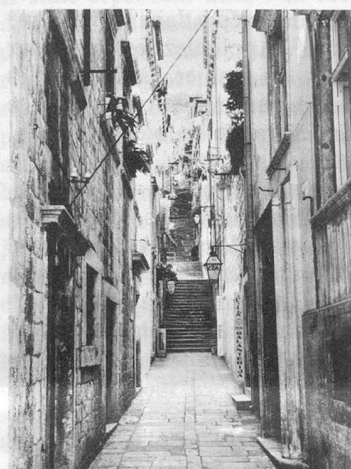
Le vieux Dubrovnik.

Evidemment, ils ne pouvaient pas acheter de cartes postales. Vous le pouvez et vous avez raison de le faire, car une jolie vue de votre lieu de séjour fera plaisir aux parents, aux enfants, aux amis. Mais cette carte est valable parce que vous l'avez personnalisée de votre écriture. Sinon ce n'est qu'une image que s'approprient tous ceux qui ont 30 centimes en poche. Elle n'est pas une vision