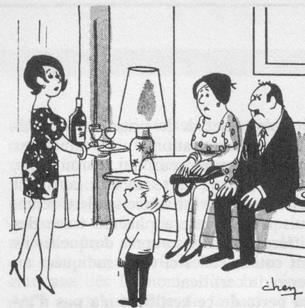
Invite-les à dîner : ils nous aideront à finir les nouilles de midi (Dessin de Chen-Cosmopress)

Théâtre — Le 28 février, à 14 h. 30, au Théâtre municipal : « La Toile d'Araignée » d'Agatha Christie. Une pièce à suspense admirablement jouée.