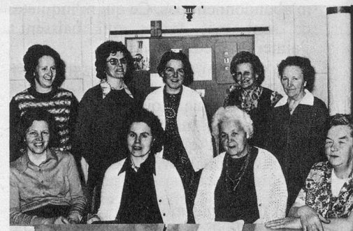
Les neuf aides ménagères