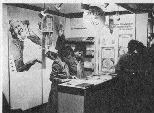
Des hôtesse souriantes.