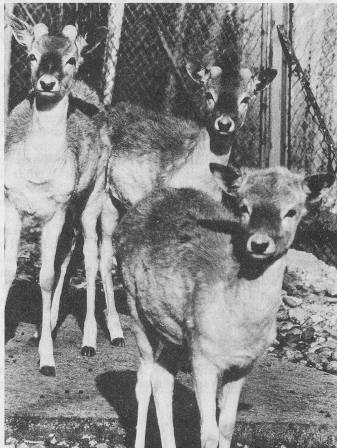
► Biches et daims : douceur et innocence.