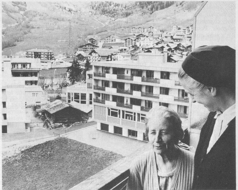
▲ Cure d'air sur les balcons de l'hôtel d'où la vue s'étend sur Loèche et les neiges de la Gemmi.