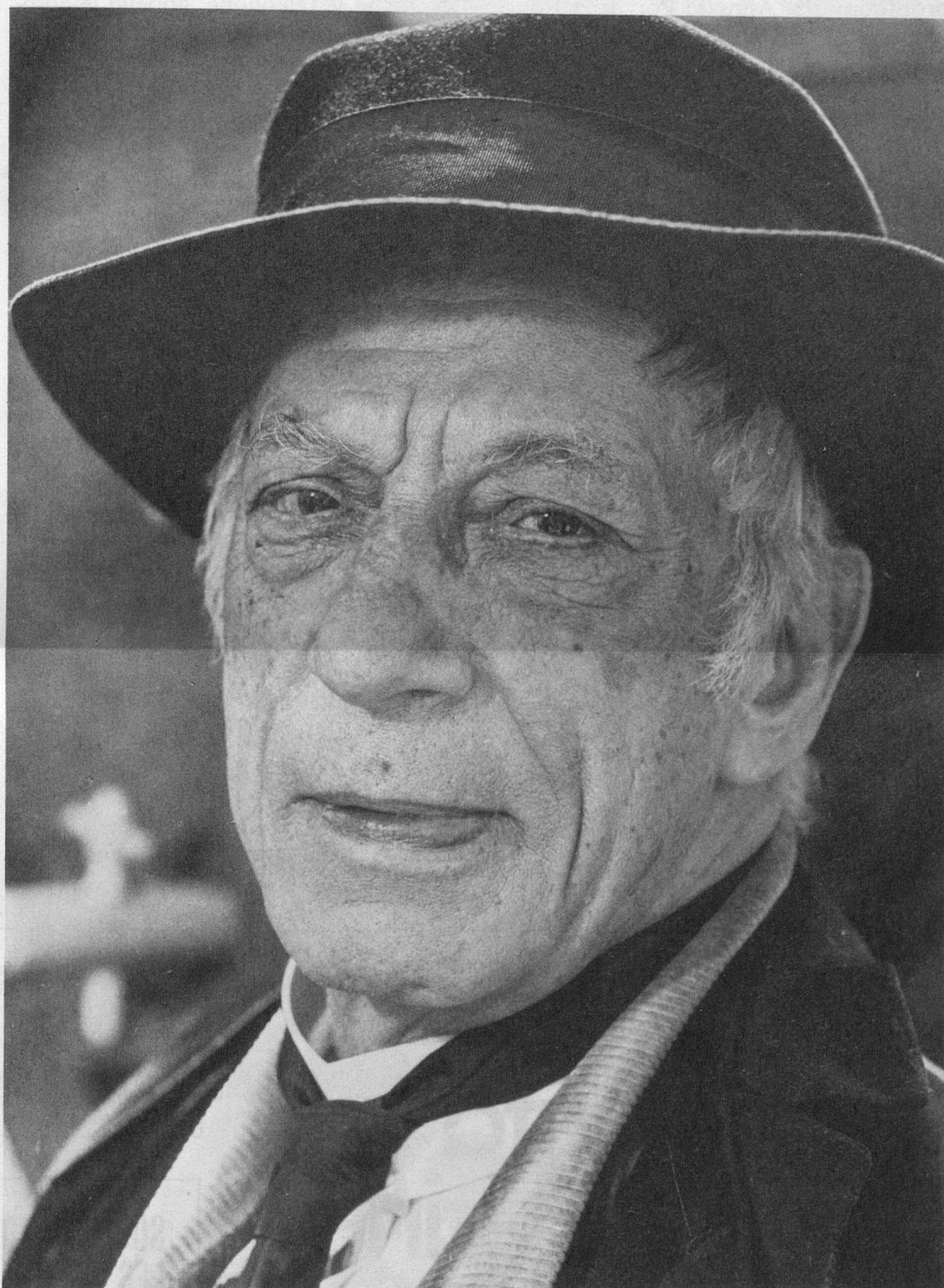
Raymond Bussières dans « Le Pain noir ».

Leur carrière, on la connaît : des films (105 pour lui !), des pièces de théâtre, des TV et un immense succès populaire dû tant à leur gentillesse qu'à leur talent. Et Dieu sait s'il leur en a fallu pour sauver, le plus souvent, des œuvrettes assez insignifiantes ! Ce qu'explique Raymond Bussières quand il dit à propos des récentes dramatiques de télévision où on l'a « découvert » (« Le Pain noir » et « La Vie de Plaisance ») : « C'est plus facile de jouer un grand rôle intéressant qu'un petit rôle dans une pièce ou un film où l'on ne se sent pas concerné. » Et, en fin de compte, Raymond Bussières s'est rarement senti concerné par les rôles qu'on lui avait proposés, avant celui, merveilleux, du Père Fraternité dans « Le Pain noir ». Un rôle qui l'a fait remarquer par tout le monde.