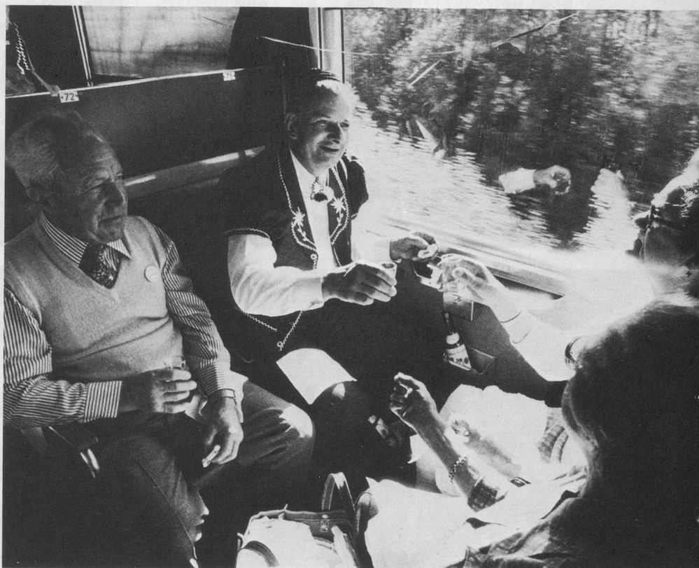
Le long serpent du train des aînés dans la rampe qui précède le tunnel du Lötschberg, côté Valais.