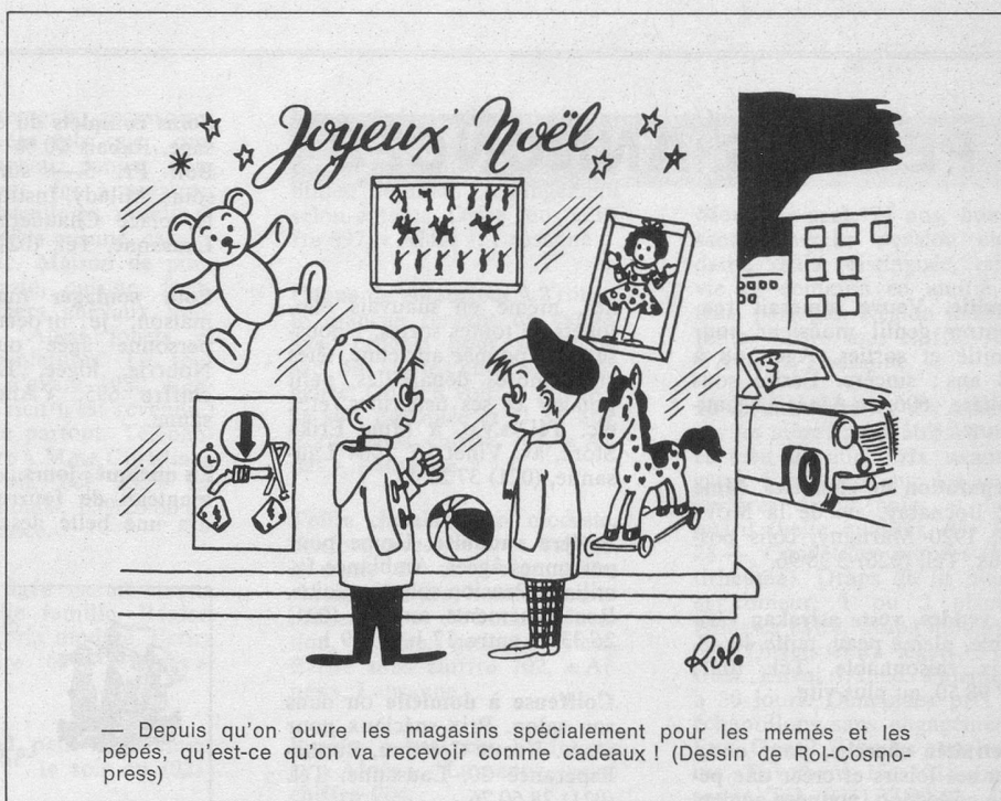
— Depuis qu'on ouvre les magasins spécialement pour les mémés et les pépés, qu'est-ce qu'on va recevoir comme cadeaux ! (Dessin de Rol-Cosmopress)

A Yverdon , le lundi 8 décembre, à la Placette, de 9 heures à 11 heures. Pour de plus amples renseignements, adressez-vous à Pro Senectute, Lausanne, tél. (021) 36 17 23.