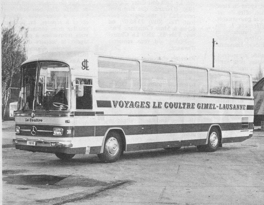
Un des véhicules de grand luxe de Le Coultre.