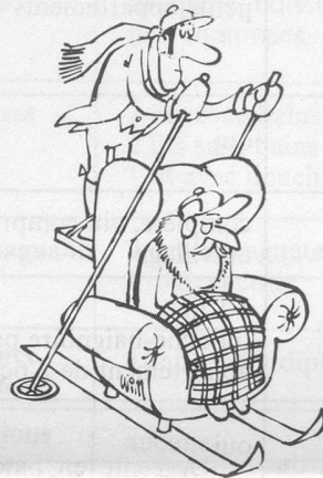
— Sans paroles. (Dessin de Moese-Cosmopress)

Il fait partie de toute chau- [mine. Dans la joie comme dans le [malheur. Et, de sa présence il l'illumine.