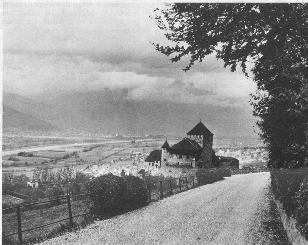
Résidence des souverains du Liechtenstein : le Château de Vaduz