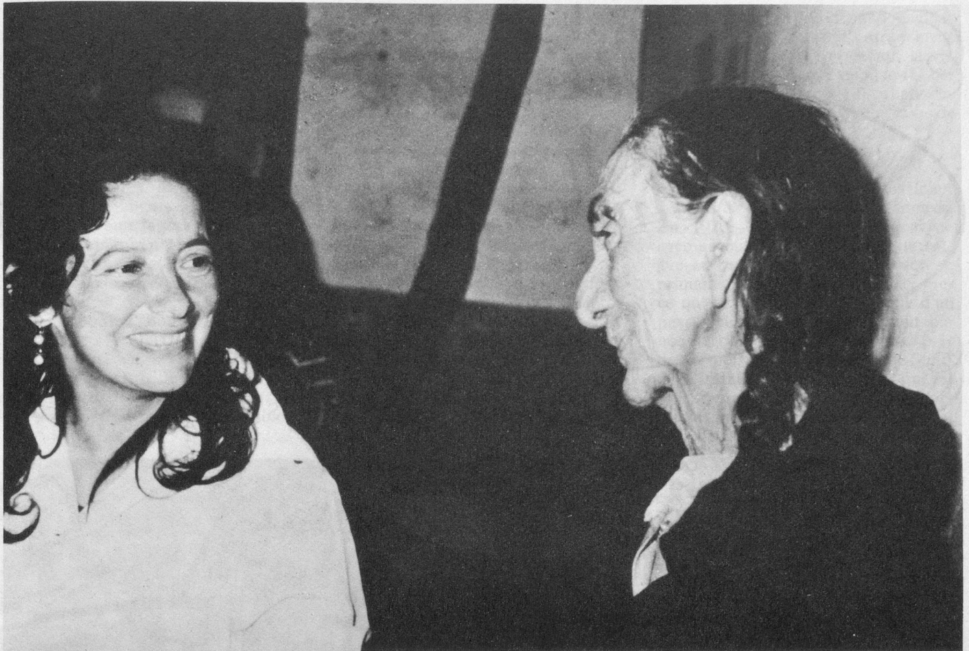
Interviewée par une journaliste, cette femme avoue 121 ans.

ment débilite et s'attaque au foie. Au bout de plusieurs années, elle peut entraîner un état d'affaiblissement général — que le voyageur non averti confond souvent avec la paresse. La majorité des habitants abritent des parasites sous une forme quelconque, notamment ténia, ascarides lombricoïdes, ankylostomes et amibes, ainsi que divers autres hôtes indésirables, particuliers à ces régions. Tous peuvent entraîner des réactions. Ils affectent le foie et les reins ; la plupart des deux cents personnes que nous avons examinées à Vilcabamba nous ont déclaré souffrir de ces organes. Une source d'étonnement pour le médecin réside dans la souplesse des muscles des centenaires qui paraissent aussi élastiques que ceux d'individus comptant la moitié de leur âge. Il