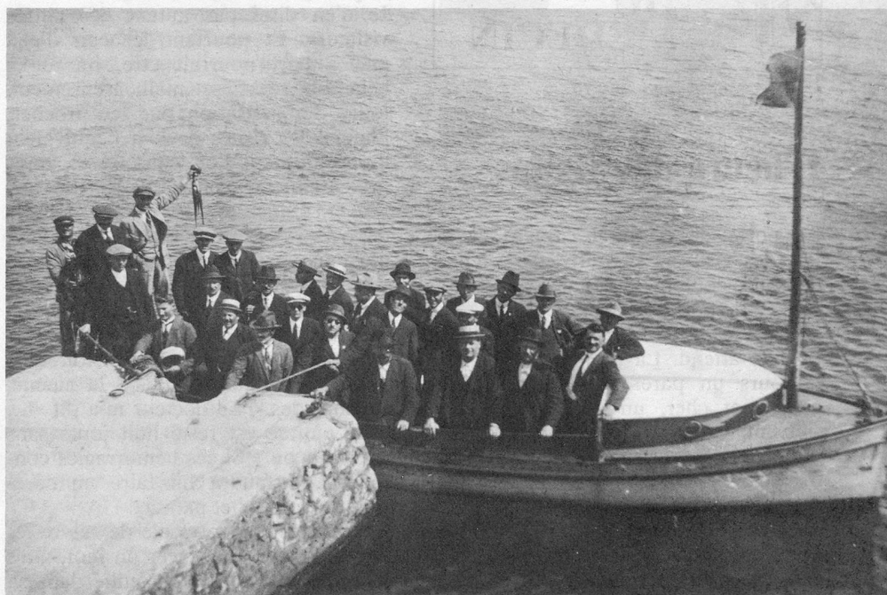
Retour de l'excursion au Château-d'If, nous ramenons une petite pieuvre.

Quand nous nous rencontrerons, dans la rue ou sur le chemin des vignes, nous nous saluerons, pendant bien des semaines encore « avé l'assent » de Marseille. A. C.