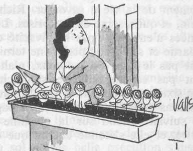
— Entre, je suis au jardin ! (Dessin de Valls-Cosmopress)

Le magasin en question est responsable à votre égard de la bonne exécution de la réparation que vous lui avez confiée. Vous n'avez pas le droit d'exiger le remplacement de l'appareil. En revanche, vous pouvez le rapporter et demander qu'on vous le répare à nouveau, et cela gratuitement.