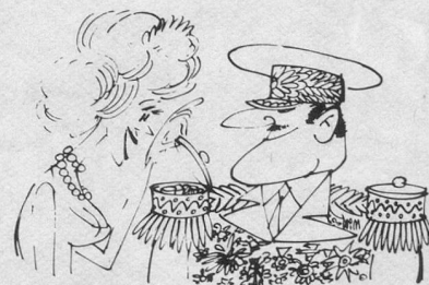
Pralines ! (Dessin de Moese-Cosmopress)

Les groupes du 3 e âge pourront donc annoncer leur venue par un simple avis, donnant l'heure de leur arrivée en train ou en car, adressé à « ADC, 2088 Cressier (NE) ». Cette adresse suffit. Les participants seront accueillis dès leur arrivée par un membre de l'ADC qui leur remettra un plan commenté du village, leur permettant de s'y promener à leur guise, de visiter l'exposition, d'assister à une présentation avec diapositives d'un « Pays de vignoble », de recevoir un catalogue-loterie (les lots sont magnifiques !), de prendre à 15 h. 45 une collation (boisson et cake) dans un établissement du village, le tout pour Fr. 5.— seulement ! Cressier se réjouit d'accueillir en toute simplicité, mais de tout cœur, ceux qui auront l'excellente idée de passer quelques heures dans ce sympathique village viticole.