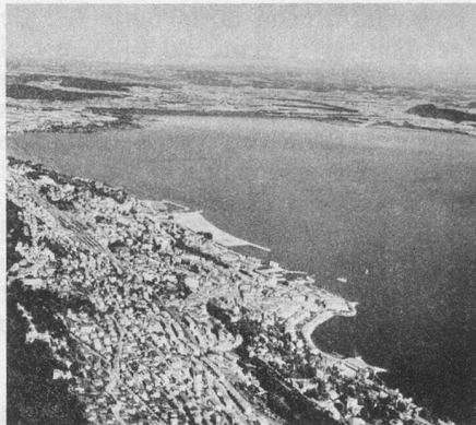
Neuchâtel, vue aérienne

Quelques places sont encore disponibles pour ces vacances, du 27 octobre au 10 novembre 1977. Pour réserver, téléphoner au (021) 22 34 29.