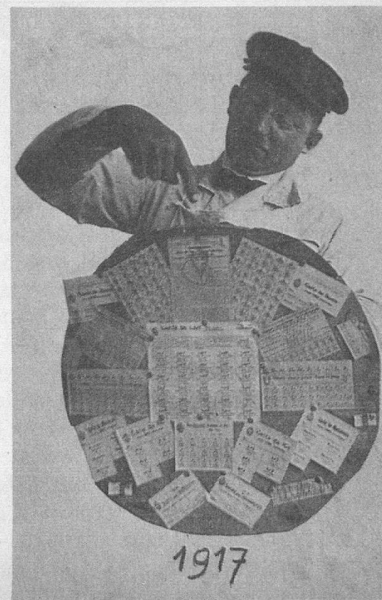
Réd. — Un document qui rappellera bien des mauvais souvenirs à de nombreux lecteurs. La photo date de 1917.

Afin d'illustrer, quant au rationnement, l'excellent article signé André Chabloz (No d'avril 78), je vous adresse une photo de mon père, à l'époque laitier-épicié à l'avenue de Cour, à Lausanne, grimaçant en tenant les divers titres de rationnement posés sur un couvercle de seille à choucroute! J'aime votre journal et je vous remercie de tous vos efforts en faveur des aînés.