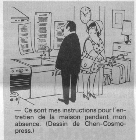
— Ce sont mes instructions pour l'entretien de la maison pendant mon absence. (Dessin de Chen-Cosmopress.)

Environ 11,5 millions de francs de subventions fédérales, environ 3 millions de la collecte d'octobre. Le reste — 1 à 3 millions de francs — provient de dons et legs.