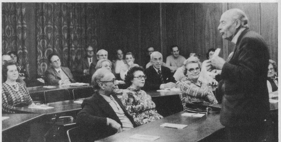
Le Dr Paul Tournier, écrivain: « A 80 ans, je me sens encore en pleine forme... »