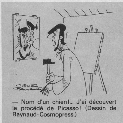
— Nom d'un chien!... J'ai découvert le procédé de Picasso! (Dessin de Raynaud-Cosmopress.)