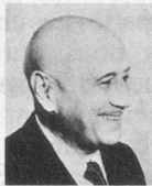
par Jean Nohain