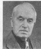
par André Chabloz