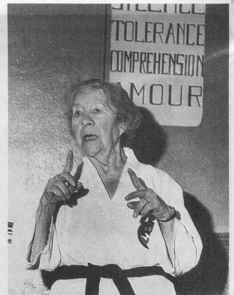
«Je suis ce que je pense...»