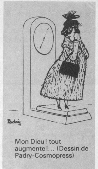
— Mon Dieu! tout augmente!... (Dessin de Padry-Cosmopress)

Dame 3 e âge aiderait bénévolement dans ménage: raccommodages, repassage, dîner, etc. Région Lausanne. Ecrire sous chiffre BV 54, «Aînés», Lausanne.