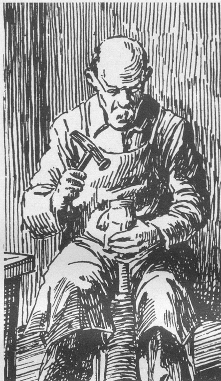
Le cordonnier (extrait de « Terre où j'ai vécu », Illustration de David Burnand, Editions Attinger, 1931).

Ma mère me donnait quatre sous et je partais en courant jusqu'à Gilly où se trouvait un cordonnier qui, probablement pour varier son travail, consentait à me tondre.