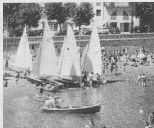
Rendez-vous à Menton!