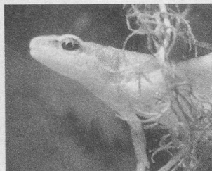
Geckos, tritons et Cie