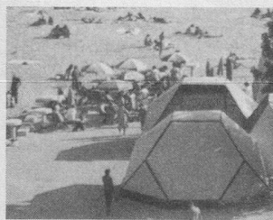
«Bine Ati Venit!» Nos vacances roumaines