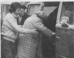
Les pages Pro Senectute. Un beau cadeau...