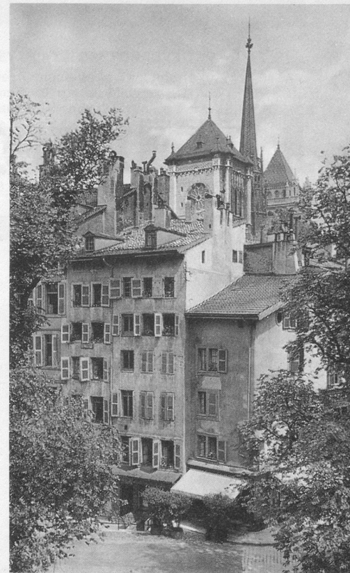
Genève, Saint-Pierre vue du Bourg-de-Four.