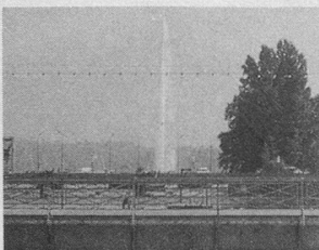
Genève sociale: une gerbe de manifestations