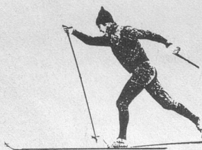
Randonnées et séjours de ski de fond