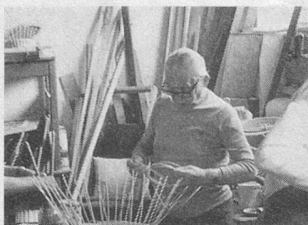
Le «Caroubier»: bilan positif