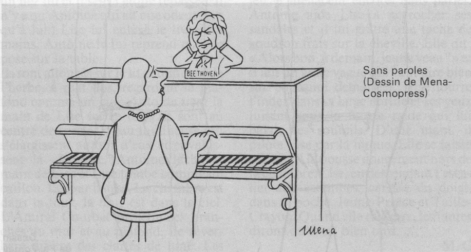
Sans paroles (Dessin de Mena-Cosmopress)

Note: pour une approche progressive de Bartók: Concerto pour orchestre, 3 e Concerto piano, 1 er Quatuor; dès lors les portes vous sont ouvertes!