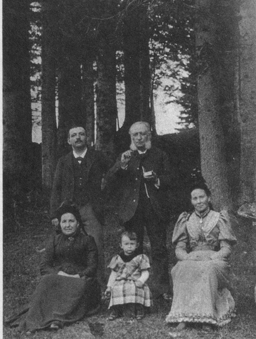
1893, Jules Humbert-Droz, âgé de 2 ans, entouré de ses parents et grands-parents.

comme les autres, d'un militant de gauche, d'un tribun qui aima Lénine et détesta Staline. Il était, cet homme, de la race des acharnés dans son combat pour le peuple et pour la paix. Que l'on partage ou non ses idées, son idéal, là n'est pas l'essentiel. Ses adversaires même ne peuvent évoquer sa mémoire et ses luttes, celles pour un socialisme qui a beaucoup évolué au cours des décennies, et celles d'un pacifiste qui mettait la non-violence au-dessus de tout, sans respect.