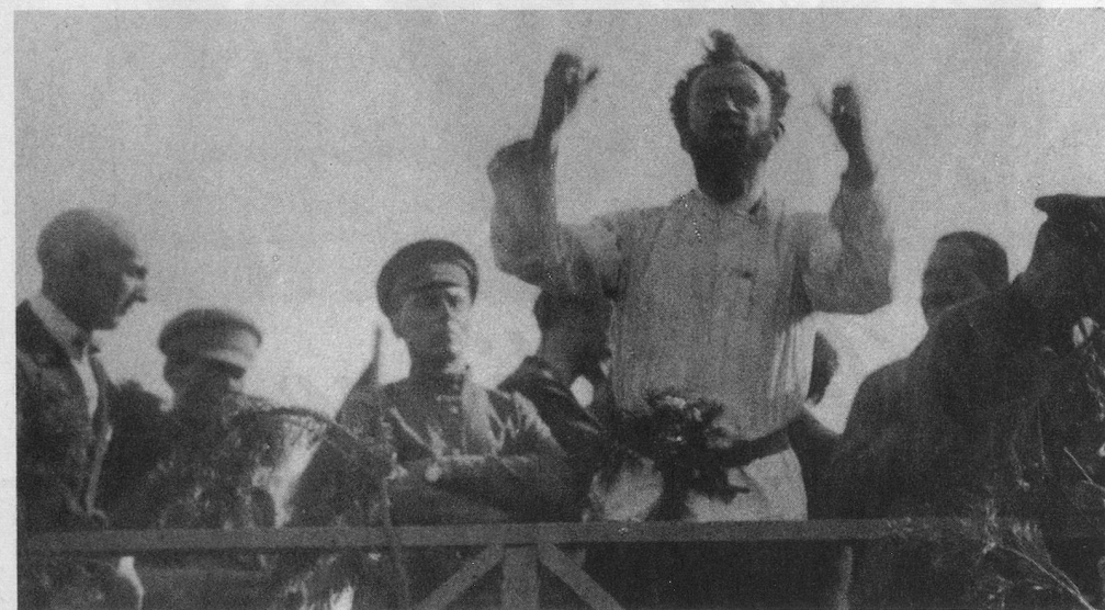
1920, 3 e Internationale. Jules Humbert-Droz à la tribune, en Russie.