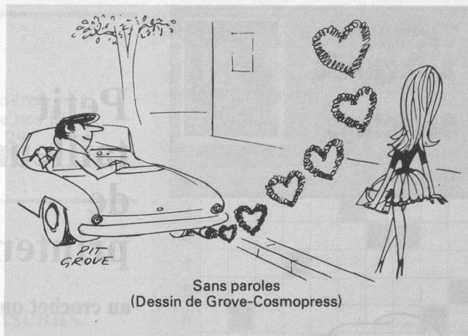
Sans paroles (Dessin de Grove-Cosmopress)

Achat vieil or payé comptant: or dentaire, vieux bijoux, montres. Envoi pour offre à la Bijouterie Bilat. 1700 Fribourg. Pêrolles 15.