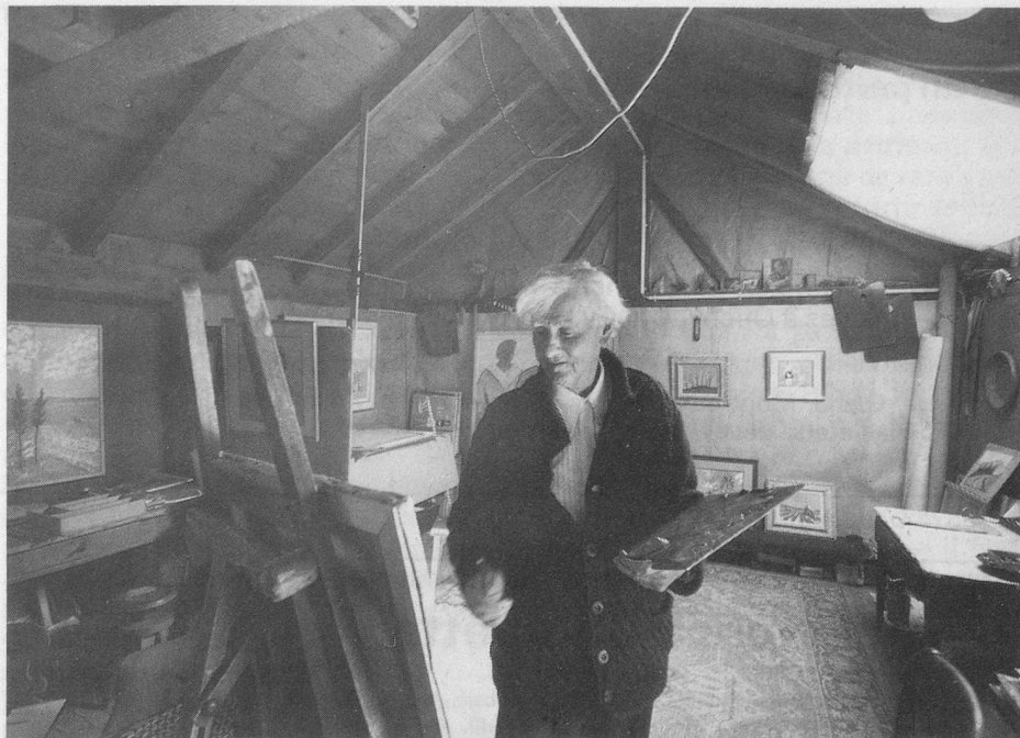
L'atelier est installé dans un mazot.

Il serait faux de rattacher Paschoud à une école quelconque, de chercher dans ses tableaux des rappels éventuels d'un peintre célèbre. Non, dans la