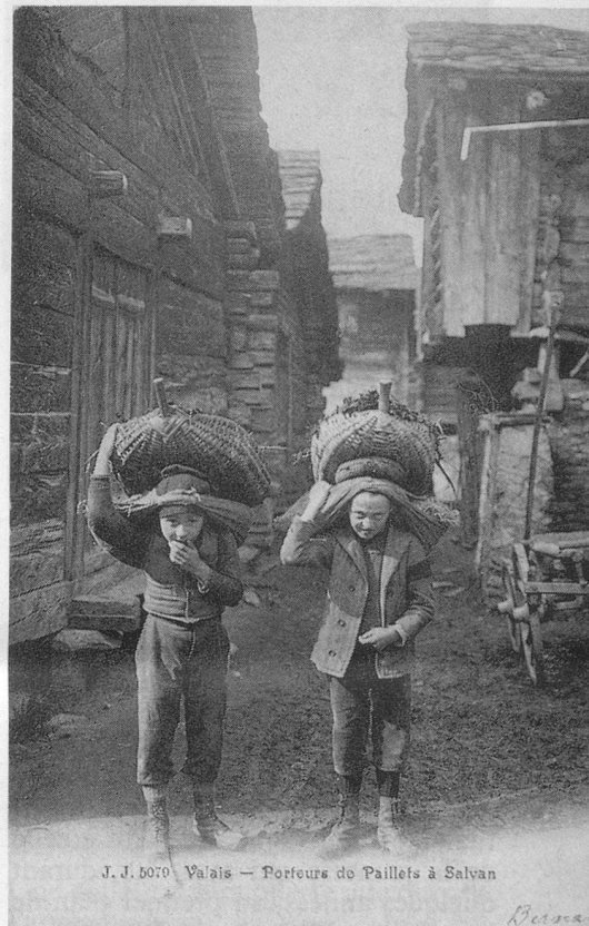
J. J. 5070 Valais — Porteurs de Paillets à Salvan

Un lecteur peut-il, en reconnaissant le paysage, me dire dans quel village on se trouve?