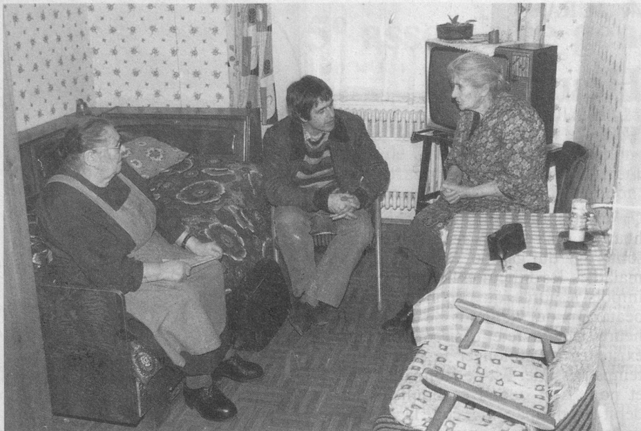
La visite, très appréciée, de l'assistant social chez les demoiselles V.