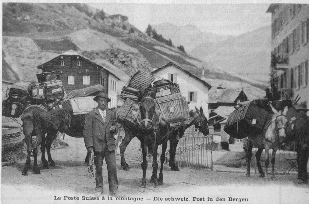
La Poste Suisse à la montagne — Die Schweiz. Post in den Bergen