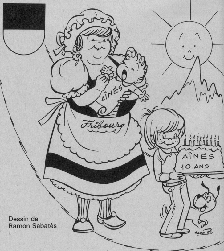
Dessin de Ramon Sabatès