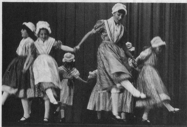
Les jeunes danseurs de l'«Onésienne» remportèrent un triomphe pleinement mérité.